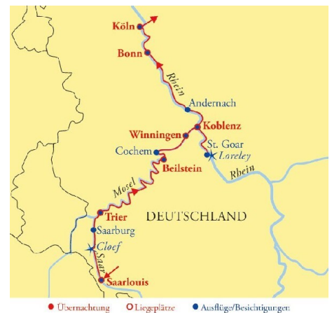
● Übernachtung ○ Liegeplätze ● Ausflüge/Besichtigungen

8. Tag: 03.10. Köln - Ausschiffung - Rückreise